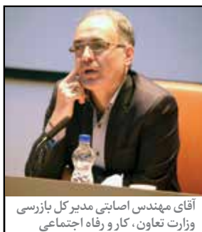
آقای مهندس اصابتی مدیرکل بازرسی وزارت تعاون، کار و رفاه اجتماعی