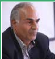
مهندس هفده تن:

بازسازی دیوار فروریخته اعتماد بین کارفرما، کارگرو دولت