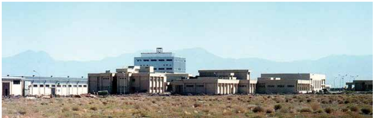
کارخانه لاستیک بارز - کرمان / پیمانکار: شرکت هریسون - سال ۱۳۶۸

پس از تفاهم سال ۱۳۸۲ با سازمان برنامه و بودجه، فعالیت‌های شورای هماهنگی به مرحله جدیدی ارتقاء یافته و رسمیت بیشتری یافت. این شورا قوانین مربوط به نظام فنی و اجرایی را در نهاد تعامل و با همراهی کمیسیون‌های زیرمجموعه تدوین و نواقص را برطرف می‌کنند. البته در این مسیر به مسائل دیگری مانند مشکلات بیمه‌های اجتماعی و مالیات برخورد می‌کنند و سعی می‌کنند از طریق سازمان برنامه آنها را پیگیری و حل نمایند. در مجموع، نهاد تعامل می‌تواند مفید و گره‌گشا باشد به شرطی که بخش خصوصی مصمم به بهره‌گیری از این نهاد باشد.