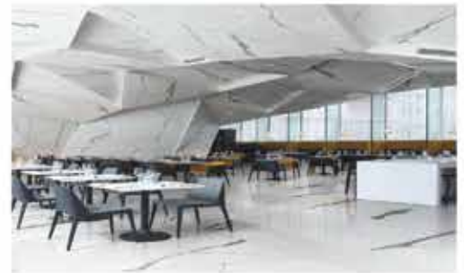
اسلب پرسلانی / ساخت ایتالیا FMG