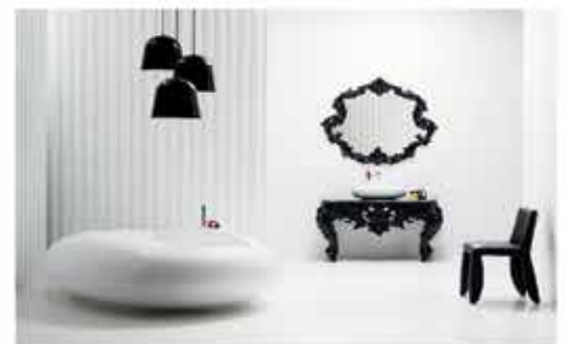
چینی آلات لوکس بهداشتی BISAZZA BAGNO