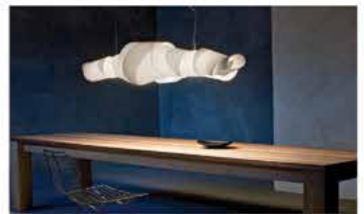
روشنایی دکوراتیو / ساخت ایتالیا FOSCARINI