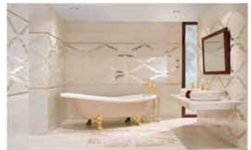
کاشی سرامیک / ساخت اسپانیا DUNE