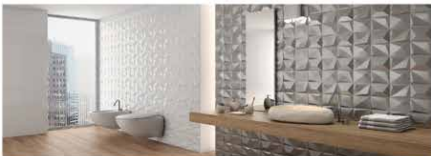
DUNE کاشی سرامیک ساخت اسپانیا