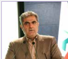
علی نیبان :

معاون وزیر راه و شهرسازی در تشریح سیاستهای دولت در بخش مسکن اظهار داشت: اولین تکلیف دولت در