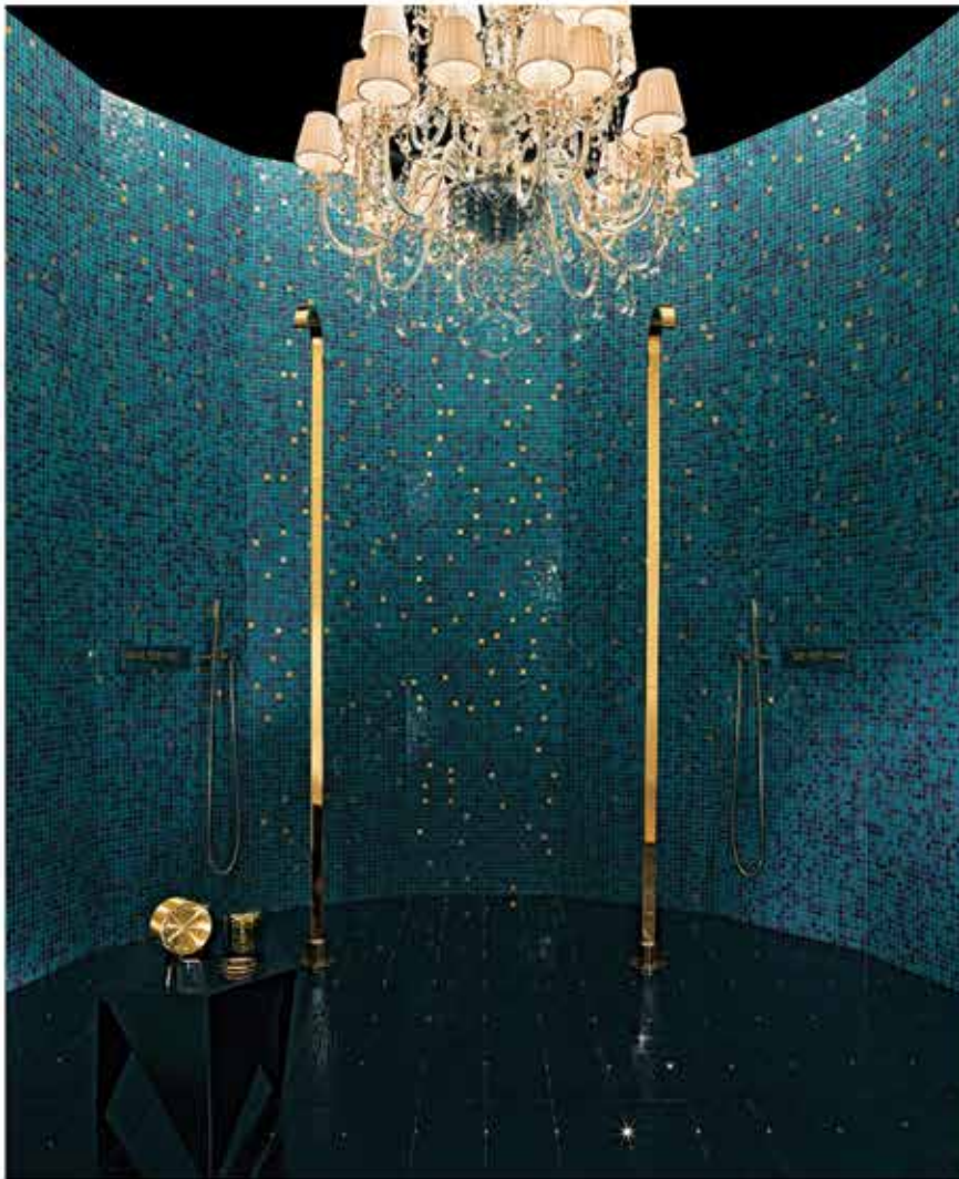
BISAZZA MOSAICO موزاییک های شیشه ای ساخت ایتالیا