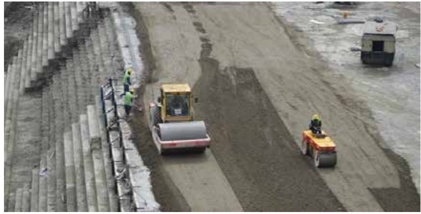
در همایش سالیانه انجمن علمی بین المللی بتن مطرح شد